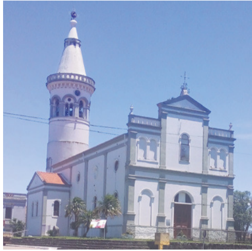
A igreja matriz de Silveira Martins, na Quarta Colônia, foi fotografada pelo leitor Edimar Ribeiro

CONCORRÊNCIA ELETRÔNICA Nº 12/2024: Objeto: contratação, pelo regime de execução indireta, do tipo “menor preço”, empreitada por preço global, com fornecimento de material e mão de obra, referente à construção de escada e passarelas metálicas externas no Centro Administrativo Municipal, localizado na Rua Venâncio Aires, nº 2277, Bairro Centro, município de Santa Maria-RS. Data de abertura: 07/06/2024, às 08h30min, no site www.comprasgovernamentais.gov.br . O Edital poderá ser acessado no site www.santamaria.rs.gov.br . Informações: (55) 3174-1501.